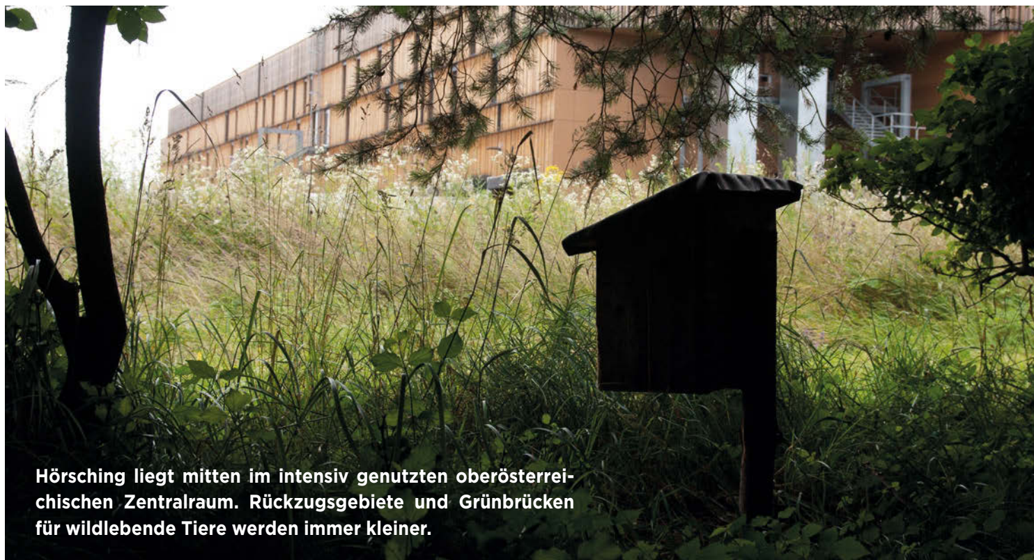
Hörshing liegt mitten im intensiv genutzten oberösterreichischen Zentralraum. Rückzugsgebiete und Grünbrücken für wildlebende Tiere werden immer kleiner.