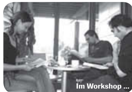
Im Workshop ...