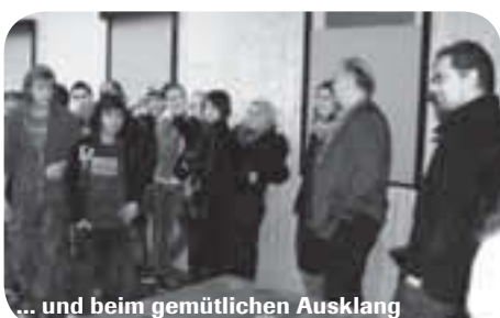
... und beim gemütlichen Ausklang

PS: „Verharren in Gelegenheitsstrukturen“ heisst nichts anderes als z.B. das stundenlange „Abhängen“ auf öffentlichen Parkbänken;-).