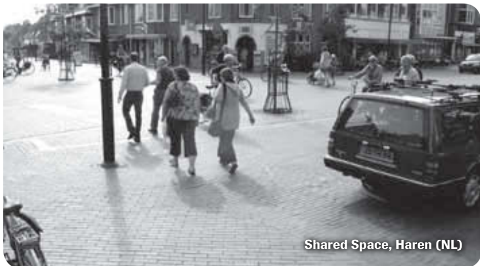
Shared Space, Haren (NL)

Die Grenzen erreicht Shared Space dann, wenn eine Durchmischung von Verkehrsteilnehmern nicht mehr stattfindet. Es bedarf eine Mindestzahl von querenden