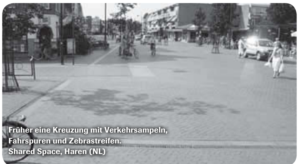
Früher eine Kreuzung mit Verkehrsampeln, Fahrsuren und Zebrastreifen. Shared Space, Haren (NL)