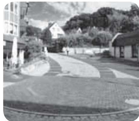
Shared Space, Nenndorf (D)

Shared Space ist ein neuer Ansatz für die Gestaltung und Organisation von Straßenräumen. Plätze, Straßen und Wege werden als Lebensraum aufgefasst, der von allen Mitgliedern der Gesellschaft geteilt und gemeinsam genutzt wird. Dieser Lebensraum soll so eingerichtet und gestaltet werden, dass er zu einem Ort der menschlichen Begegnung, der Kommunikation und des sozialen Umgangs wird.