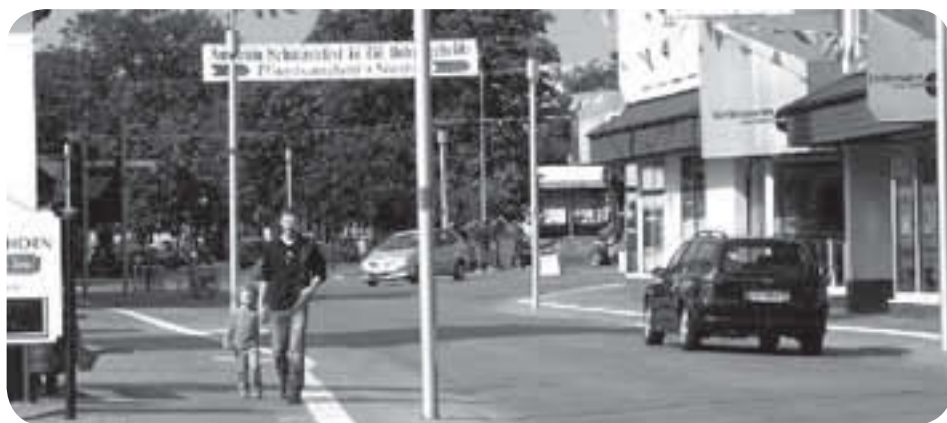
Shared Space, Bohmte (D)