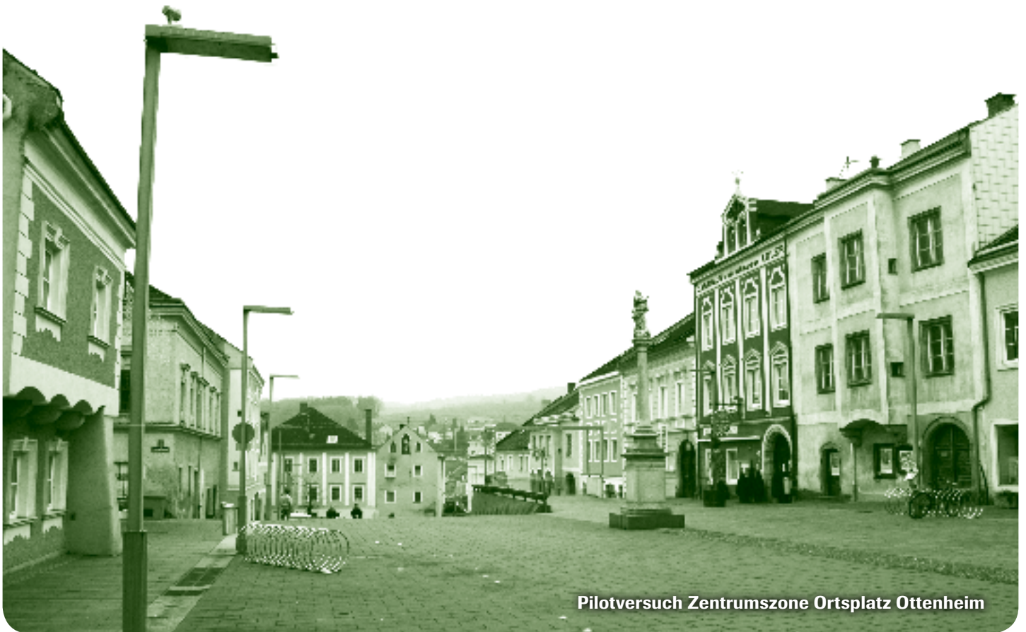
Pilotversuch Zentrumszone Ortsplatz Ottenheim

Fußgängern und anderen Verkehrsteilnehmern, um die angestrebte Verlangsamung des Kfz- Verkehrs zu erreichen. Auch Plätze und Straßen mit hohem Parkdruck sind wenig geeignet, um Shared Space umzusetzen. Nicht ausreichend gesicherte Bereiche werden erfahrungsgemäß schnell zugeparkt. Das führt in der Regel zu einer Verschlechterung der eminent wichtigen Sichtbeziehungen zwischen den Verkehrsteilnehmern.